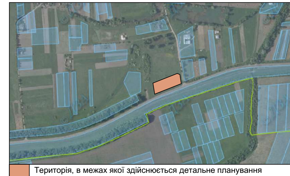
Територія, в межах якої здійснюється детальне планування