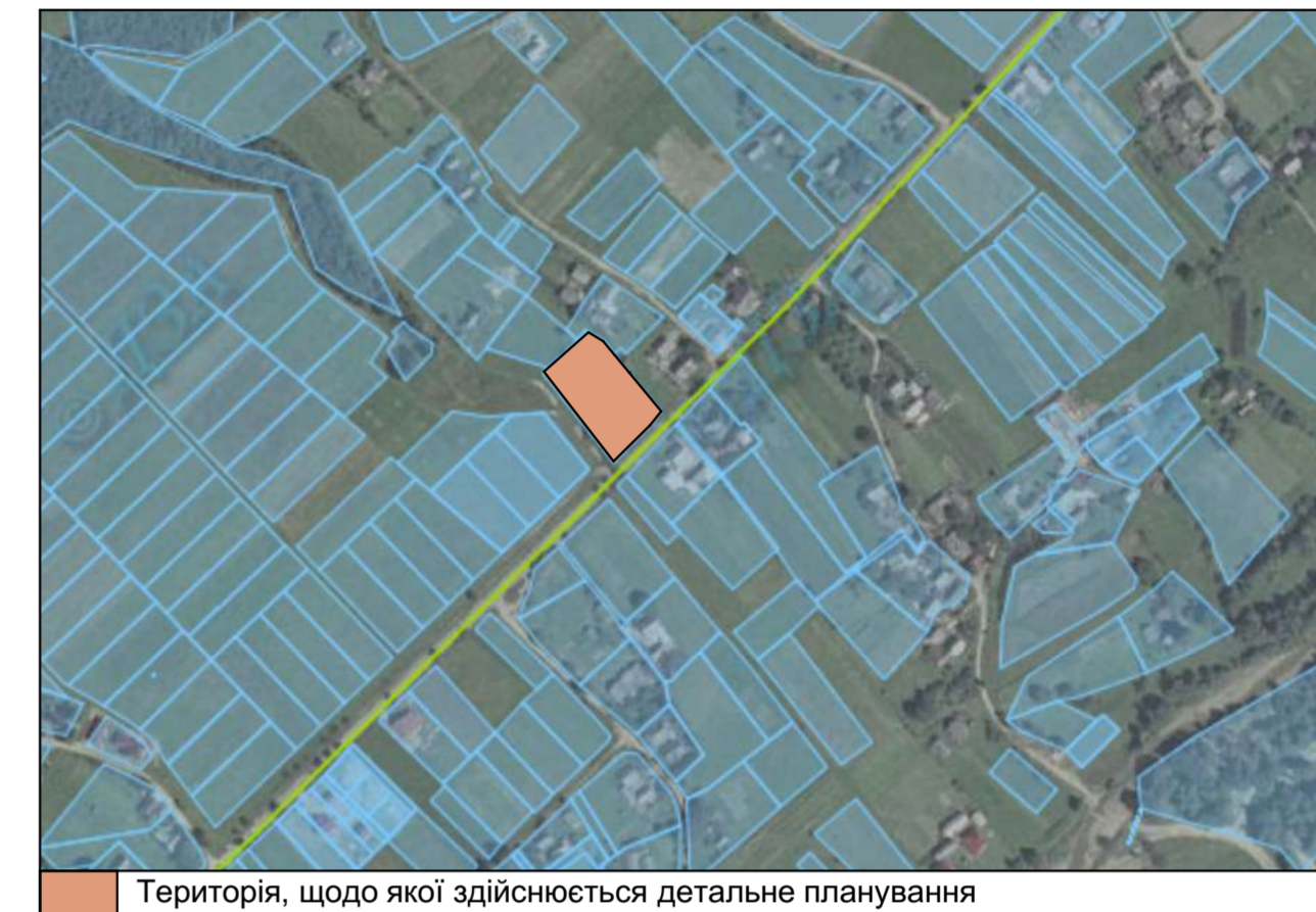
Територія, щодо якої здійснюється детальне планування