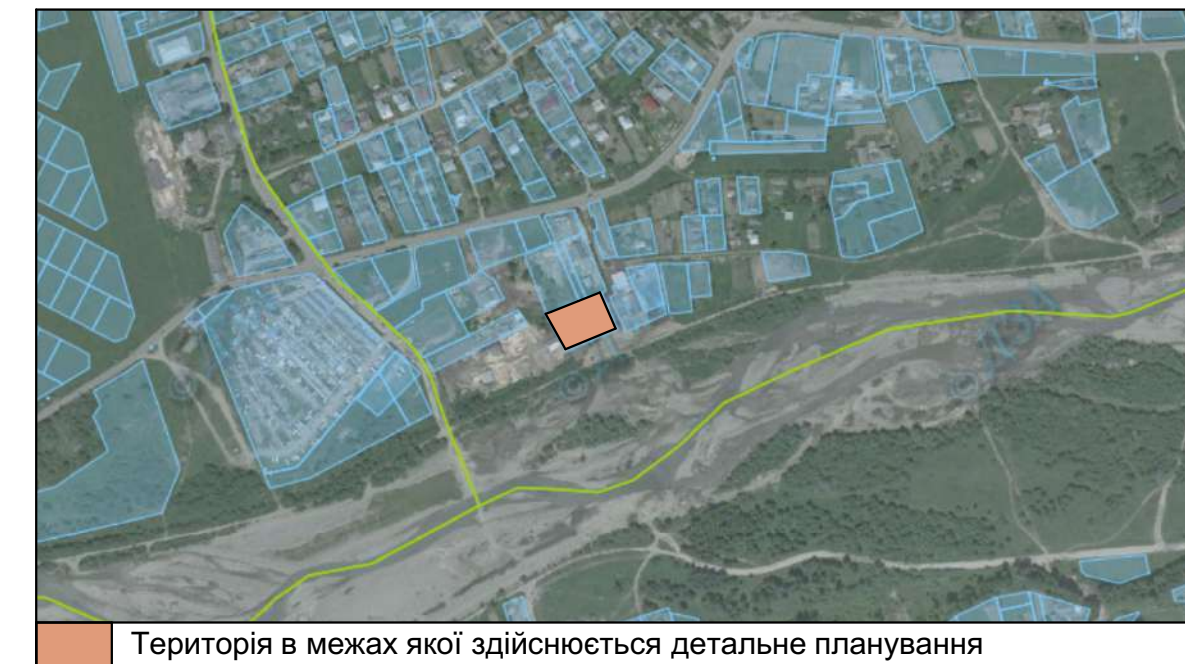
Територія в межах якої здійснюється детальне планування