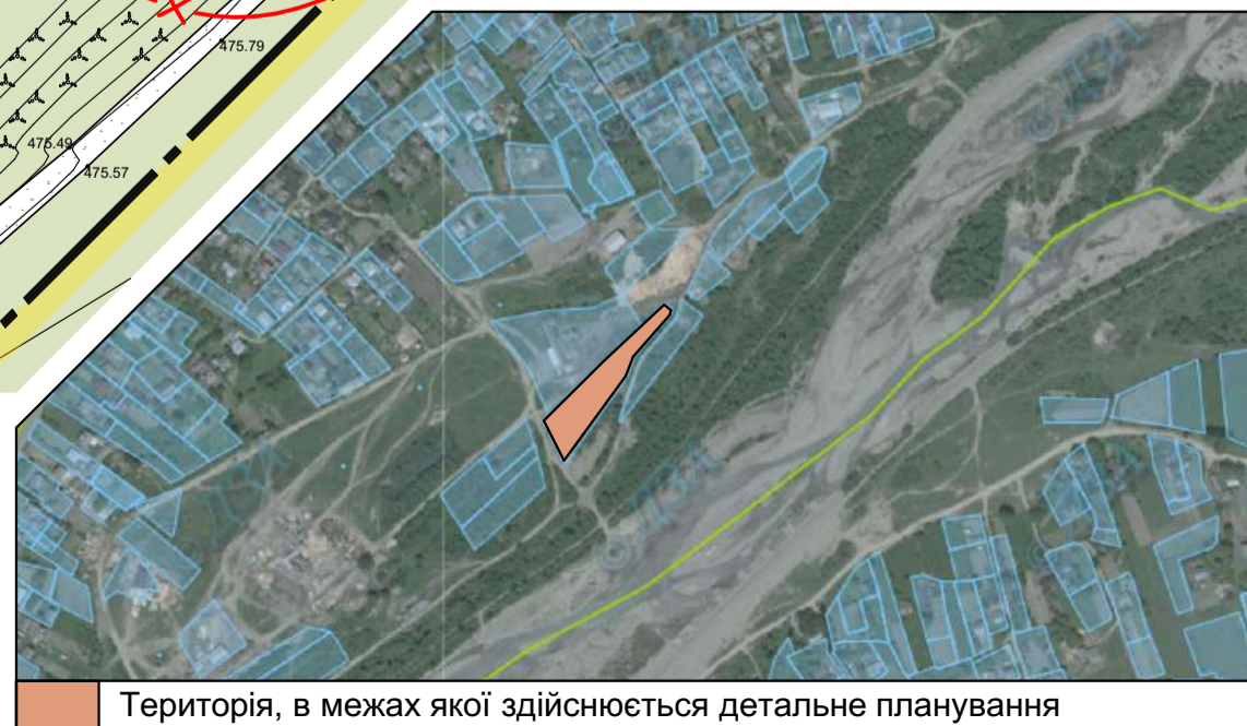
Територія, в межах якої здійснюється детальне планування